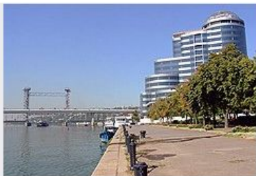
Помещения в БЦ «Риверсайд» продают мелкой нарезкой.

К моменту ввода офисного центра девелопер распродал 70% площадей